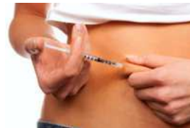
Tipps für Ihren Blutzucker-spiegel