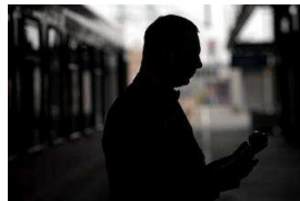
Fahrgast schubst Schaffnerin aus Zug