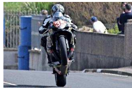
Wheelie: Rentner (75) verliert die Kontrolle